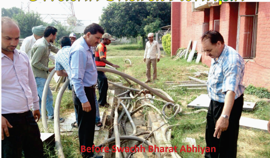
Before Swachh Bharat Abhiyan