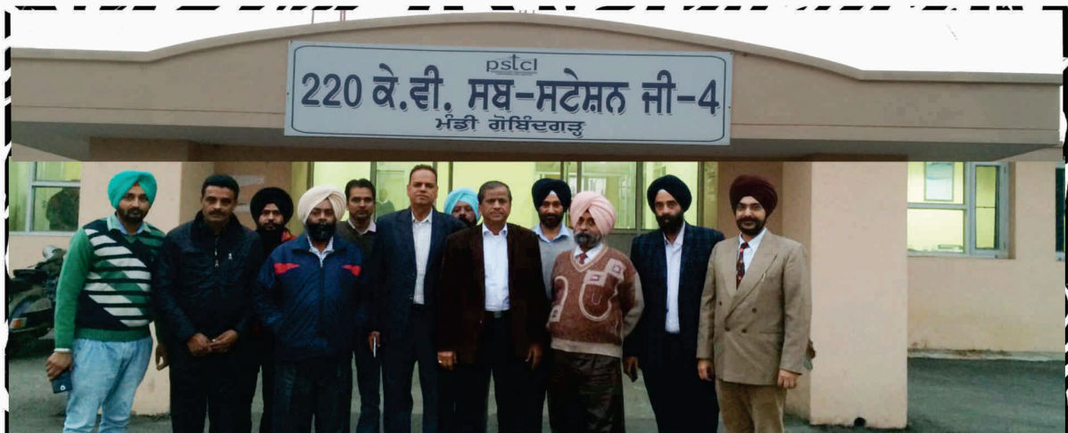
ਜੀ-4 ਗਰਿਡ ਸਬ ਸਟੇਸ਼ਨ ਵਿਖੇ ਮਾਨਯੋਗ ਸੀ.ਐਮ.ਡੀ. ਪੀ.ਐਸ.ਟੀ.ਸੀ.ਐਲ., ਸਾਰੇ ਆਫੀਸਰ ਅਤੇ ਸਟਾਫ ਨਾਲ