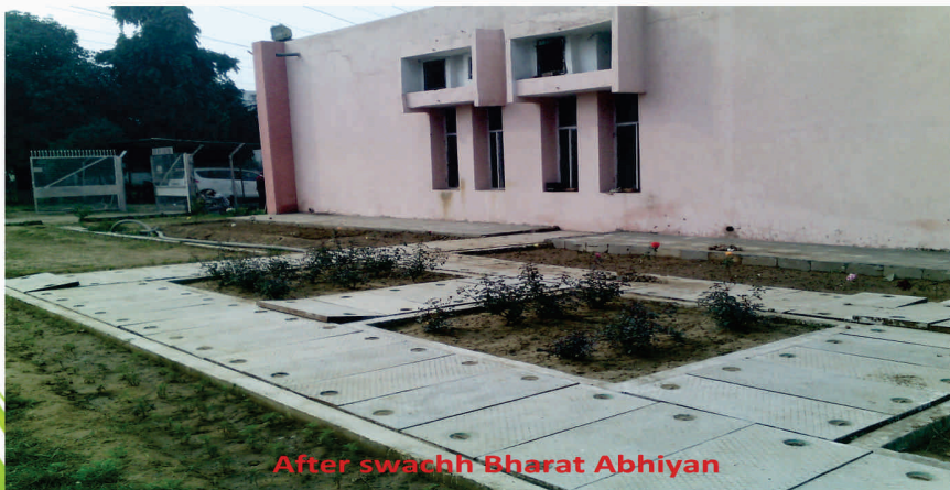
After swachh Bharat Abhiyan